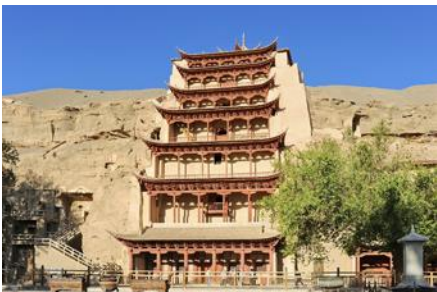
ถ้ำหินบัวเวาคุ

พักที่ REZEN HOTEL ระดับ 4 ดาวท้องถิ่นหรือเทียบเท่าในเมือง เจี๋ยวิ้วกวน