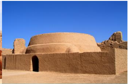
เมืองโบราณเกาซางกู๋เจิง