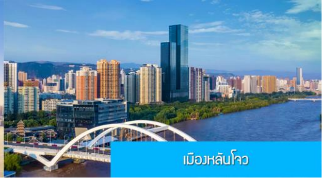
เมืองฮานอย