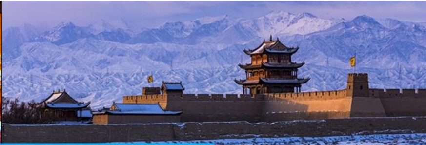
ด่านเจี๋ยวิ้วกวน