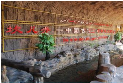
ระบบชลประทานกู๋หลู่ฟาน

พักที่ HAMPTON BY HILTON HOTEL โรงแรมระดับ 4 ดาวหรือเทียบเท่าในเมืองกู๋หลู่ฟาน