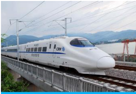
นักรถไฟความเร็วสูง