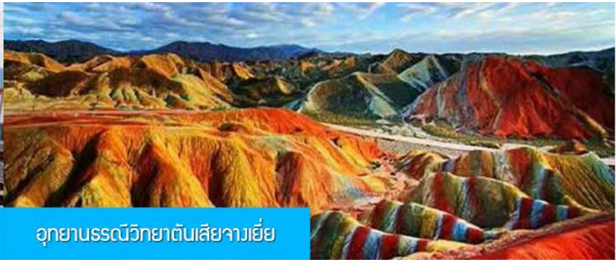
อุทยานธรณีวิทยาต้นเสียวายี

วันที่สอง เมืองหลันโจว – นักรถไฟความเร็วสูงสู่เมืองจางเยี่ย – เที่ยวชมอุทยานธรณีวิทยาต้นเสียว (ภูเขาสายรุ้ง)