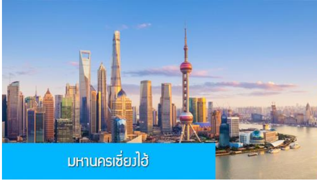
มหานครเซี่ยงไฮ้